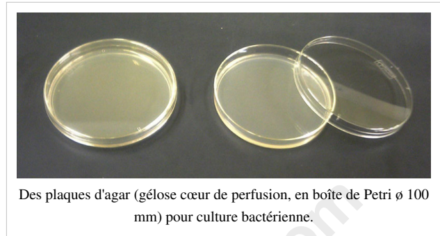
Des plaques d'agar (gélase cœur de perfusion, en boîte de Petri ø 100 mm) pour culture bactérienne.

Le mucilage extrait à chaud de ces algues donne après purification, déshydratation et broyage la poudre d'agar-agar utilisée essentiellement pour gélifier un grand nombre de produits alimentaires mais aussi les milieux de culture pour les micro-organismes ou les cultures in vitro [8] . Il est appelé kanten au Japon où il est utilisé dans certaines pâtisseries, ou traditionnellement sous forme de Tokoroten . Il est alors commercialisé sous forme de longues barres transparentes ou en poudre. Cette substance s'utilise en très petites quantités. Elle n'a pratiquement ni goût ni couleur. C'est un liant et gélifiant végétal parfait pour remplacer la gélatine animale. Il existe une multitude de recettes dans lesquelles l'agar-agar peut être utilisée : confitures, gelées de fruits, flans... La gelée se forme à condition d'être chauffée à 90 °C, mais ne « prend » qu'à une température de 40 °C environ. L'agar-agar permet de servir des mousses chaudes. L'agar-agar rentre aussi dans la composition d'un aérogel appelé SEAgel qui est similaire à de l'aérogel organique, avec un goût et une consistance rappelant les gâteaux de riz.